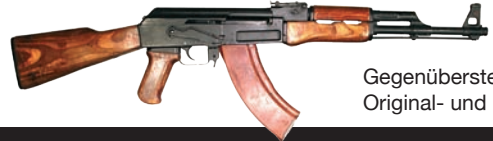
Gegenüberstellung Original- und Miniaturwaffe